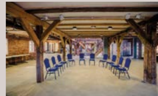
Kornspeicher - Salon Ruth, 1.OG

Raumhöhe: 2,8 m - Raumgröße: 4,2 x 9,8 m/42 m 2 Seeblick, partiell Verdunkelung, historische Altinstallationen