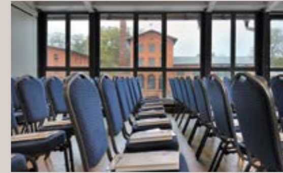
Rinderstall - Salon Arnold, 1.OG

Raumhöhe: 2,7 -4,4 m - Raumgröße: 12,2 x 12,5 m/154 m 2 Seeblick, Verdunkelung, barrierefrei