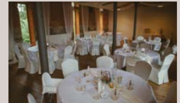
Kälberstall - Salon Luise, EG

Raumhöhe: 3,3 m - Raumgröße: 7,7 x 6,1 m/44 m 2 Seeblick, Blick auf die Dampfmaschine, keine Verdunkelung