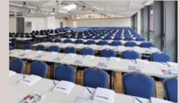
Rinderstall - Salon Conrad, 1.OG

Raumhöhe: 2,7 -4,4 m - Raumgröße: 13,3 x 12,5 m/167 m 2 Seeblick, Verdunkelung, barrierefrei