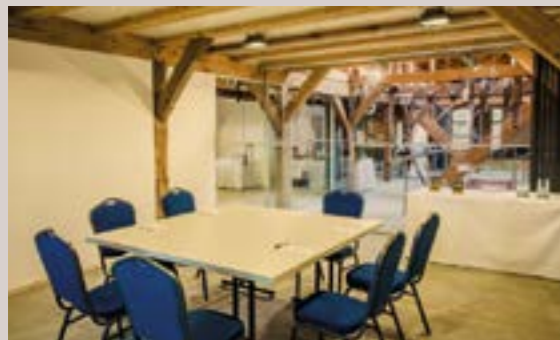
Kornspeicher - Salon Margret, 1. OG

Raumhöhe: 3,4 m - Raumgröße: 7,20 x 17,40m/125 m 2 Seeblick, keine Verdunkelung, barrierefrei