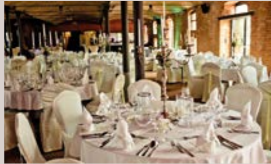
Rinderstall - Salon August, EG

bekannt für seine Architektur , die Gartenbaukunst und Dendrologie und natürlich auch für die umgebende herrliche Landschaft. Die berühmten Eisenbahnen Borsigs stehen für Innovation und Mobilität , das einzige erhaltene landwirtschaftliche Mustergut Deutschlands verkörpert Erfindungs- und Fortschrittsgeist . Unsere 125 Jahre alte Druckwerkstatt oder die 85 Jahre alte Borsig-Dampfmaschine sind Bestandteile unseres einmaligen Rahmenprogrammes.