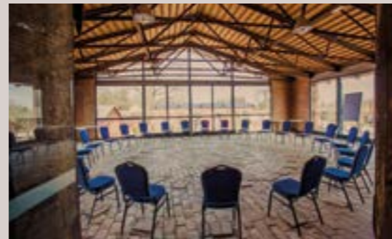
Brennerei - Panorama, 1.OG

Raumhöhe: 3,1 m - Raumgröße: 10,8 x 5,3 m/58 m 2 , Nebenraum mit 13 m 2 , Verdunkelung, barrierefrei