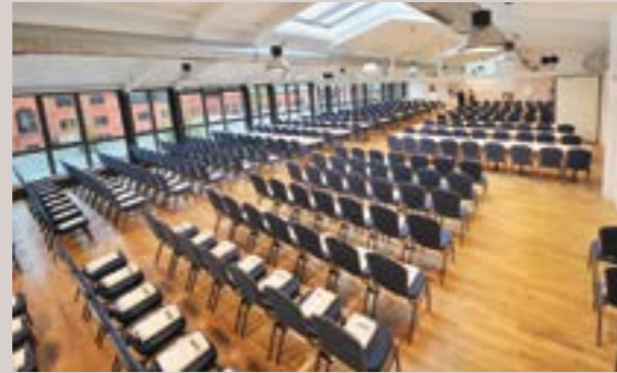
Rinderstall - Salon Conrad, Arnold und Ernst, 1.OG

Raumhöhe: 3,1 m - Raumgröße: 42 x 14 m/597 m 2 Befahrbar mit PKW, keine Verdunkelung, barrierefrei