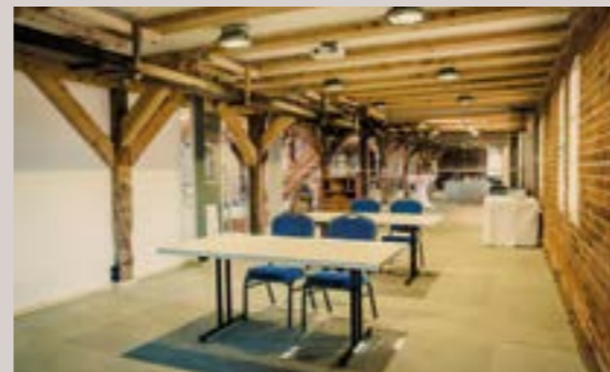
Kornspeicher - Salon Annelise, 1.OG

Raumhöhe: 2,8 m - Raumgröße: 4,2 x 9,8m/42 m 2 Seeblick, partiell Verdunkelung, historische Altinstallationen