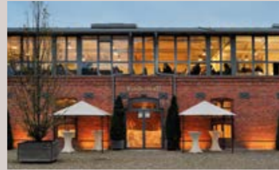
Rinderstall - Salon Ernst, 1.OG

Raumhöhe: 2,7 -4,4 m - Raumgröße: 40,4 x 12,5 m/505 m 2 Seeblick, Verdunkelung, barrierefrei