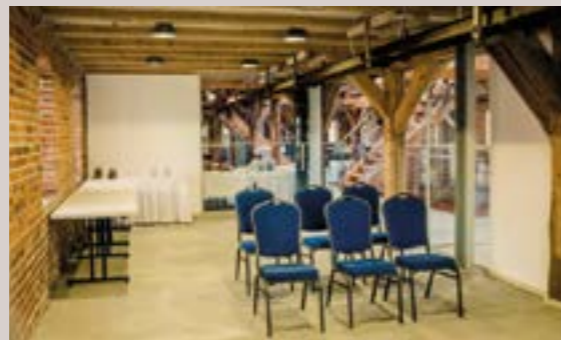
Kornspeicher - Salon Lilli, 1.OG

Raumhöhe: 2,8 m - Raumgröße: 4,4 x 6,1m/27 m 2 Seeblick, Verdunkelung, historische Altinstallationen