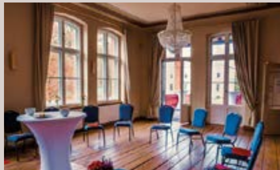
Gutsverwalter - Salon Albert, Hochparterre

Raumhöhe: 2,7 -4,4 m - Raumgröße: 14,2 x 12,5m/178 m 2 Seeblick, Verdunkelung, barrierefrei