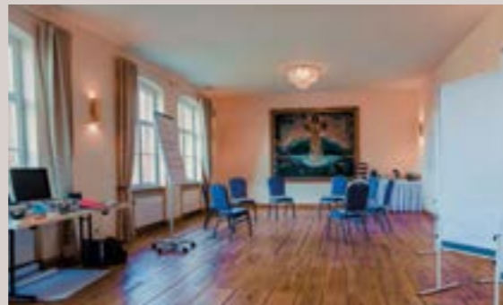
Gutsverwalter - Salon Anna, 1.OG

Raumhöhe: 3,7 m - Raumgröße: 4,5 x 15,4 m/78 m 2 , Ein Nebenraum mit 13 m 2 , Verdunkelung, barrierefrei