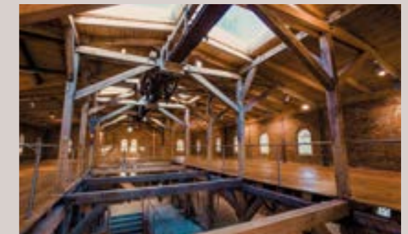
Kornspeicher - Kreativgalerie, 2.OG

Raumhöhe: 2,8 m - Raumgröße: 9,3 x 13,2 m/122 m 2 Partiell Verdunkelung, historische Altinstallationen